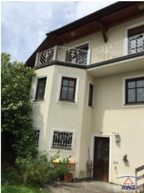
Hintereingang zum Keller