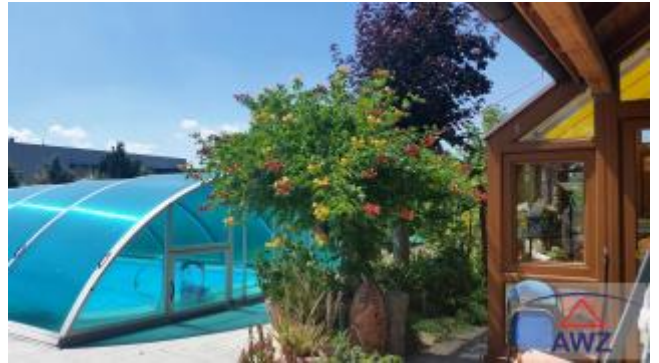
Terrasse zum Pool